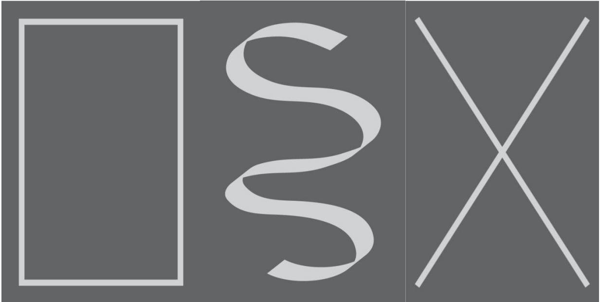
Şekil 2: Yanlış uygulama şekilleri.